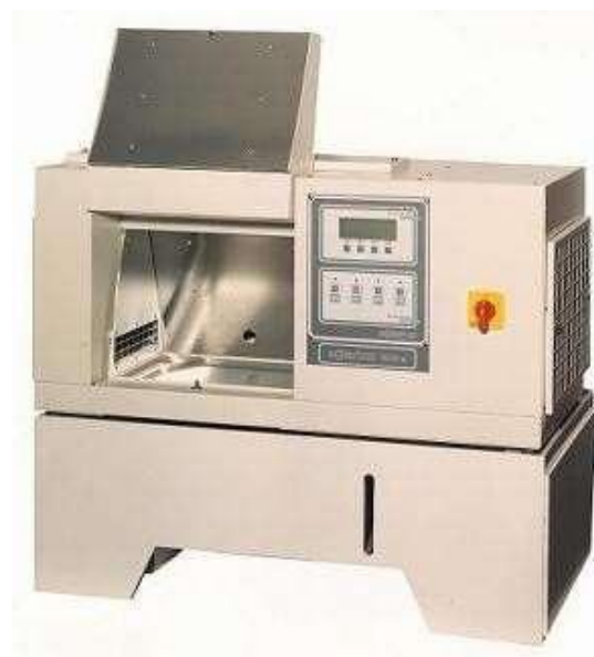
SOLARBOX 1500 E con FLOODING

Il sistema di allagamento standard funziona con acqua demineralizzata che viene riciclata tramite un circuito chiuso, consentendo un risparmio notevole di acqua demineralizzata rispetto ai sistemi spray a circuito aperto. Materiali in PVC e resistenti alla corrosione assicurano lunga vita al sistema. Capacità fino a 50 litri.