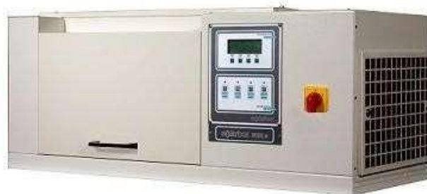
SOLARBOX 3000 E

Di conseguenza, in quanto la temperatura produce un invecchiamento accelerato, è essenziale essere in grado di controllare la B.S.T. durante la prova di esposizione a radiazione Xeno filtrata.